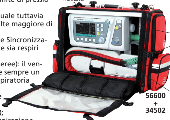
Tubo campionamento flusso