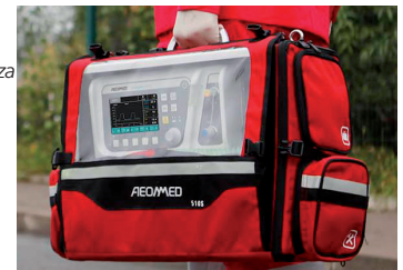
Borsa per il trasporto dotata di staffe