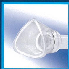
SIZE 0 (Neonatale-1 mese) - (Neonatal - 1 Month) ACO389P