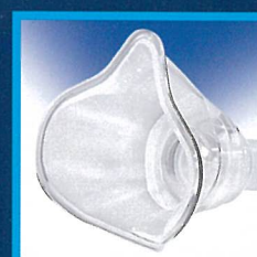
SIZE 2 (1 - 3 Anni) - (1 - 3 Years) ACO391P