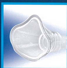
SIZE 1 (1 - 11 mesi) - (1 - 11 Months) ACO390P