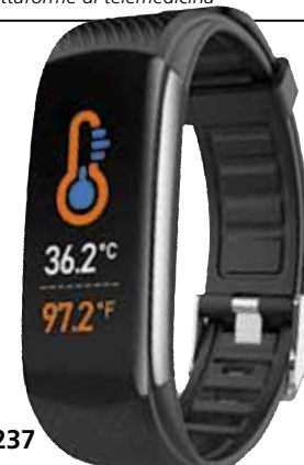
4 parametri di salute + passi & distanza + 3 attività sportive