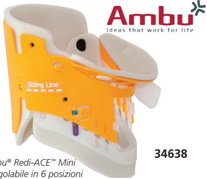
Ambu® Redi-ACE™ Mini è regolabile in 6 posizioni