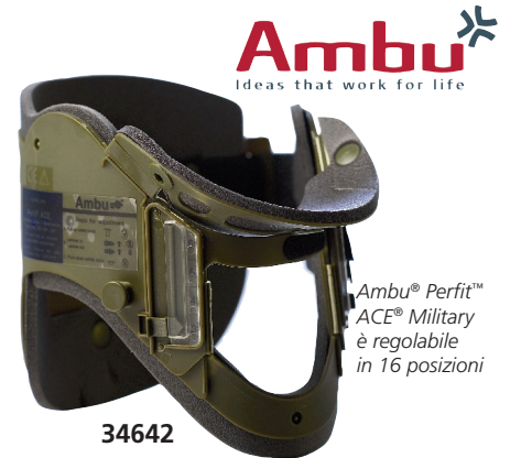
Ambu® Perfit™ ACE® Military è regolabile in 16 posizioni

Il collare Ambu Perfit è un collare rigido per mantenere la posizione neutra e impedire movimenti antero-posteriori e laterali del collo o l'estensione della colonna cervicale durante il trasporto