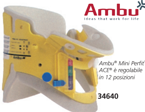
Ambu® Mini Perfit™ ACE® è regolabile in 12 posizioni