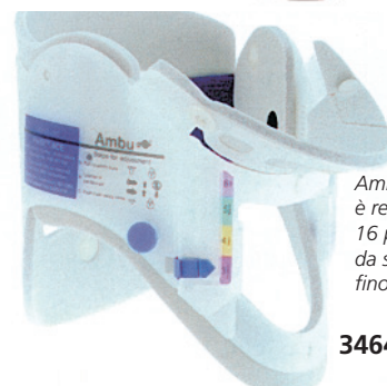
Ambu® Perfit™ ACE® è regolabile in 16 posizioni: da senza collo (misura 3) fino a alto (misura 6)