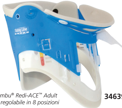
Ambu® Redi-ACE™ Adult è regolabile in 8 posizioni