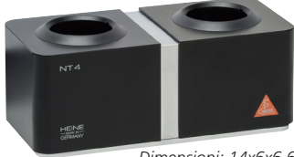
Dimensioni: 14x6x6,6 cm

• 34449 CARICATORE NT 300 PER 2 MANICI - X-002.99.495