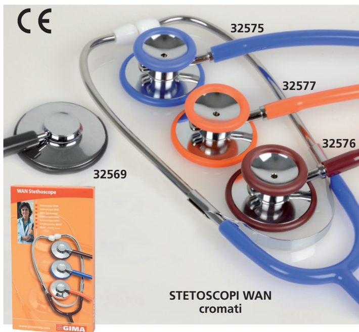
STETOSCOPI WAN cromati