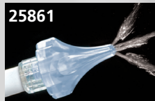
Tecnica brevettata a 3 getti. Compatibile con 25804, 25809, raccordo Luer Lock standard (forma conica)