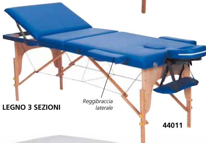
LEGGNO 3 SEZIONI