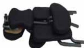
Sedia da massaggio piegata