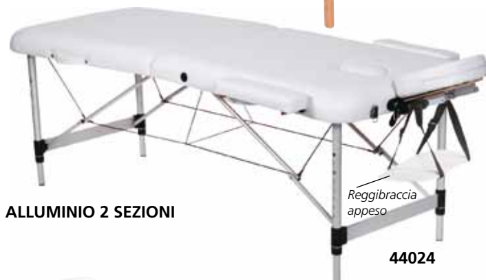
ALLUMINIO 2 SEZIONI