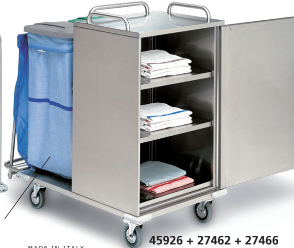
45926 + 27462 + 27466