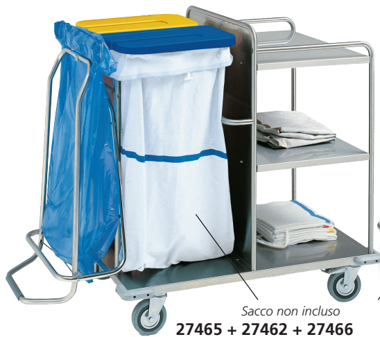
Sacco non incluso 27465 + 27462 + 27466